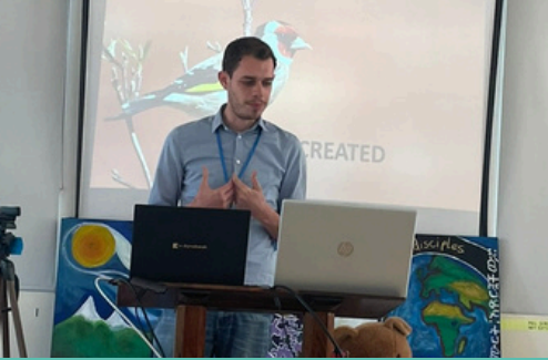
Presentatie van onze 'Personal creed'