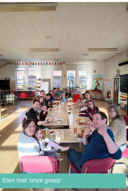
Eten met 'onze groep'