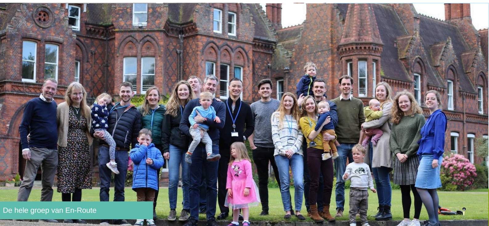
De hele groep van En-Route