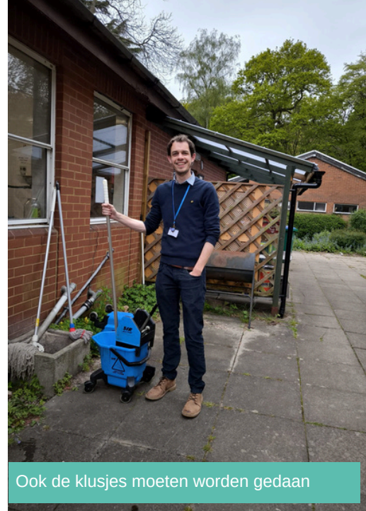
Ook de klusjes moeten worden gedaan