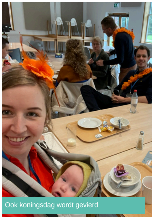
Ook koningsdag wordt gevierd