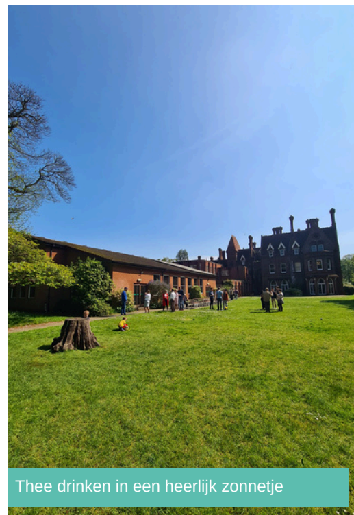
Thee drinken in een heerlijk zonnetje