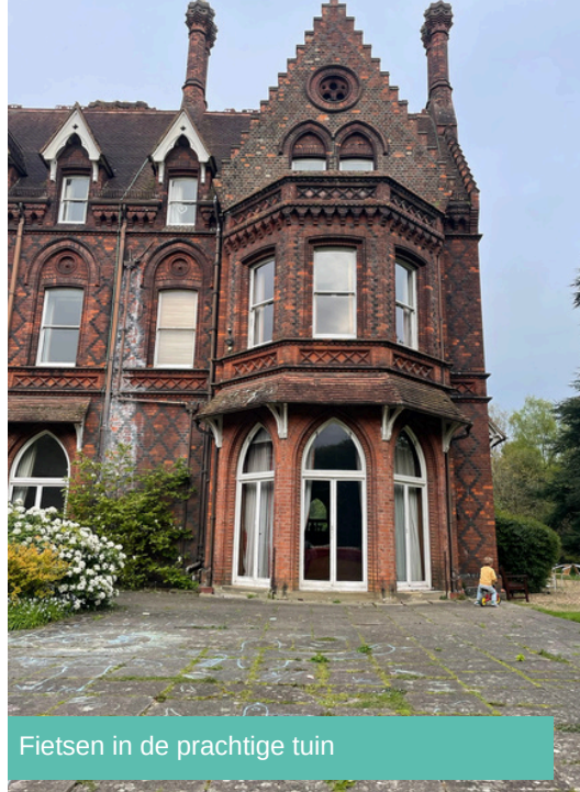
Fietsen in de prachtige tuin