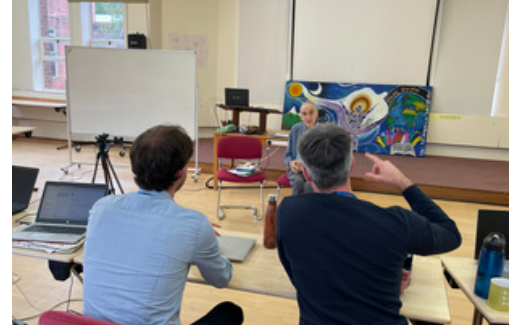
Les over de geschiedenis van zending