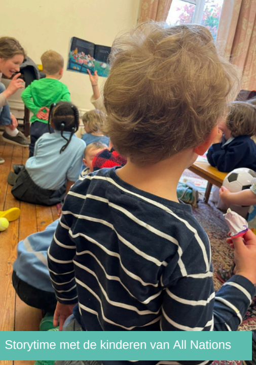
Storytime met de kinderen van All Nations